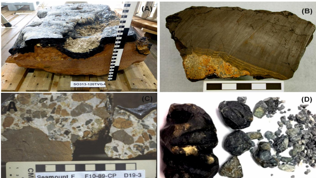
Abbildung 1: Beispiele für Eisen-Mangankrusten (A, B) und Phosphorite (C, D) vom Meeresboden.

2016). Abbauwürdige Gehalte der Lagerstätten an Land liegen bei 1 % bis 5 % für die Festgesteine, bei 0,5 % für Seifen und bei 0,05 % für Ionenaustauschtonen (Elsner et al., 2025). Die marinen Vorkommen können aufgrund ihrer chemischen und mineralogischen Zusammensetzung am ehesten mit den Seltenen-Erden-reichen Tonen an Land verglichen werden. Über die Gesamtgehalte an Seltenen Erden hinaus sind eine Reihe weiterer Faktoren für die Abbauwürdigkeit einer Lagerstätte von Bedeutung: Neben den Anteilen der technologisch wichtigen Seltenen Erden Neodym, Praseodym, Dysprosium und Terbium sind auch die Größe einer Lagerstätte, ihr geologischer Aufbau und ihre Tiefe im Untergrund, die Aufbereitbarkeit der Erze und nicht zuletzt die Marktpreise entscheidend. In Landlagerstätten sind meistens nur die sog. leichten Seltenen Erden (inkl. Neodym) in signifikanten Mengen angereichert. Schwere Seltene Erden, zu denen Dysprosium und Terbium gehören, kommen an Land nur in Tonlagerstätten in abbauwürdigen Mengen vor. Im Gegensatz dazu enthalten marine Vorkommen oft hohe Anteile an schweren Seltenen Erden.